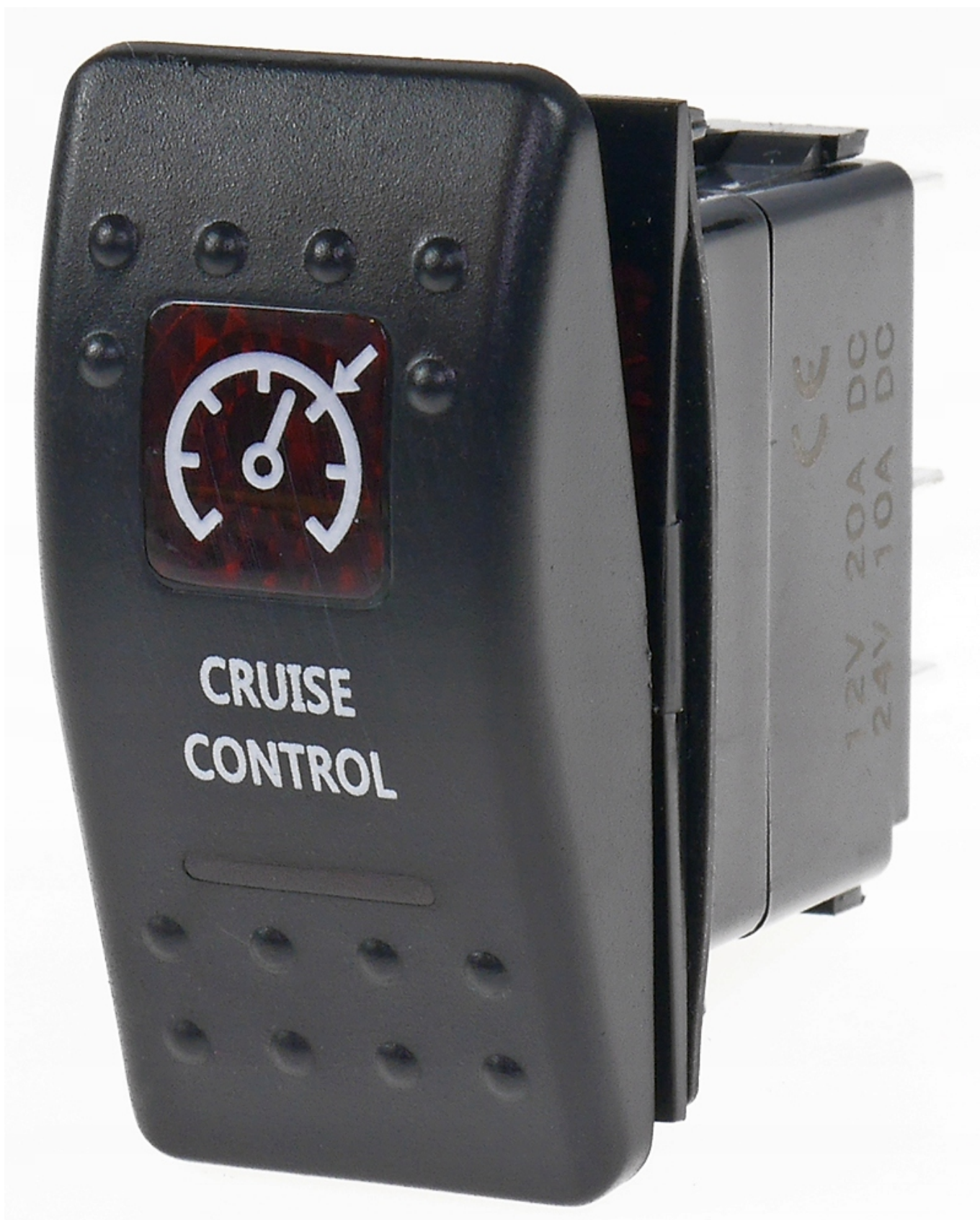
Wysokiej klasy włącznik 5-pin, 2-poz. ON-OFF ; podświetlany, typ piktogramu i napis jak na zdjęciu głównym ( miniaturka )