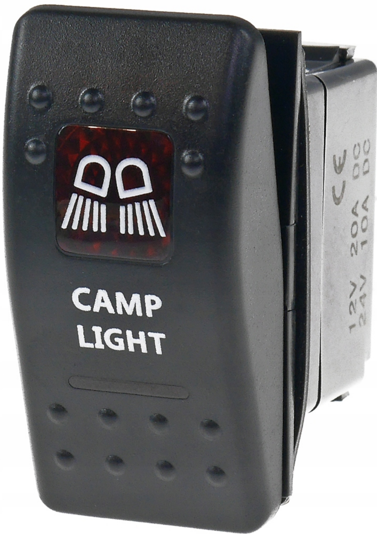
Wysokiej klasy włącznik 5-pin, 2-poz. ON-OFF ; podświetlany, typ piktogramu i napis jak na zdjęciu głównym ( miniaturka )