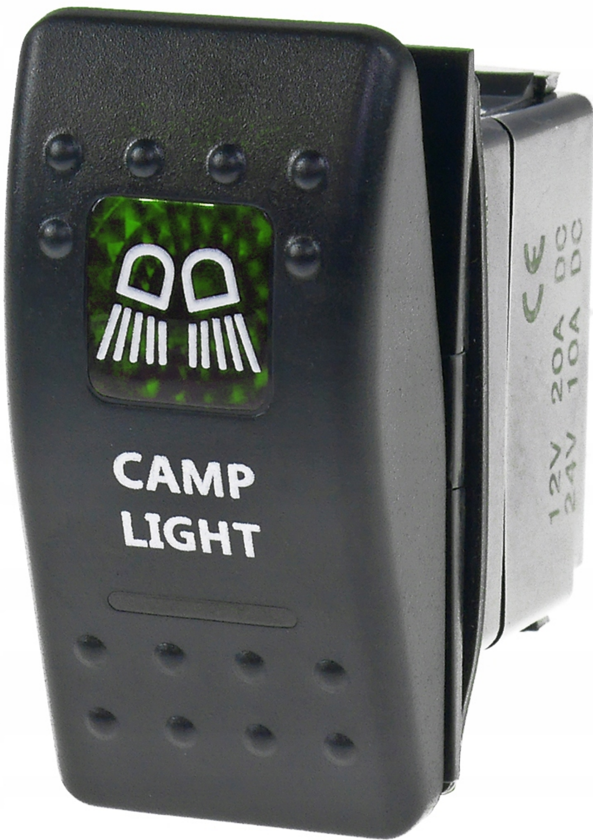
Wysokiej klasy włącznik 5-pin, 2-poz. ON-OFF ; podświetlany, typ piktogramu i napis jak na zdjęciu głównym ( miniaturka )